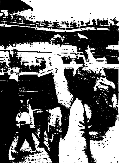
امرات فرنسية في وديع زوجها على حفلة الطائرات كليمسو، في طابون.